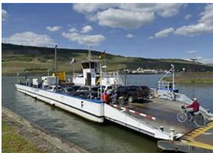
Fähre Rüdesheim - Bingen

Von nun an geht es auf den Heimweg nach Frauenfeld, wo wir ca. um 20.45 eintreffen werden.