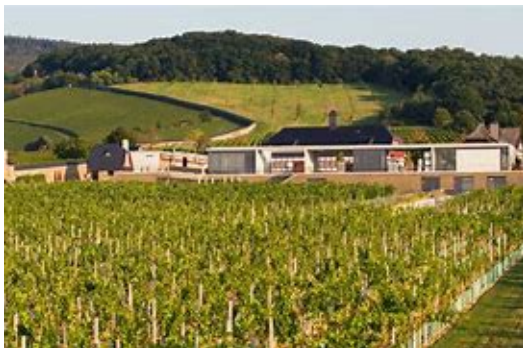
Domäne Steinberg (Kloster Eberbach)