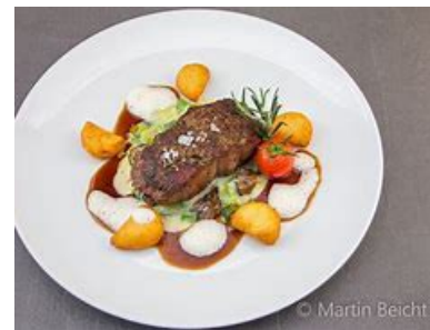
aus der Küche