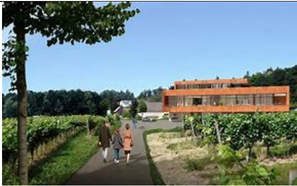
Weingut Kopp Sinzheim