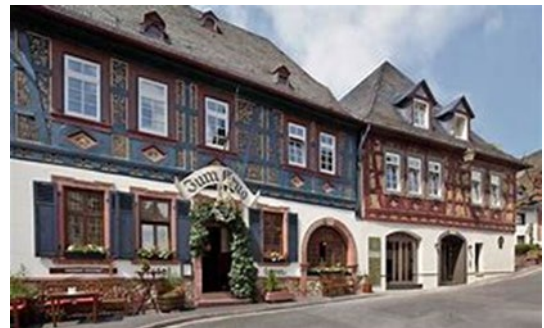
Restaurant und Weinhaus zum Krug