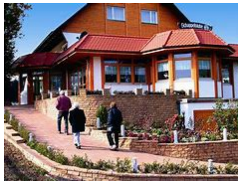
Unser letzter Halt (Schappelstube)